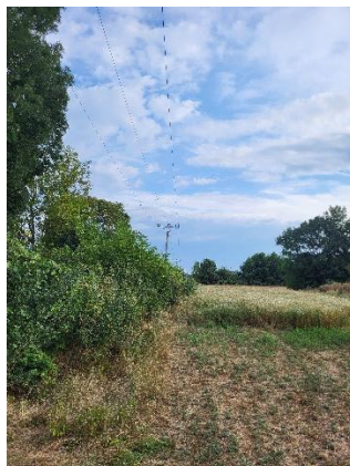
2. Pohľad z p.č.911/12